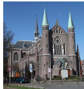
De St. Josefkerk

Het was 1573 en de Alkmaarders waren bang. Bang voor de Spanjaarden. Spanje en Holland waren in oorlog en de Spanjaarden trokken Noord-Holland in om steden te veroveren. Naarden werd door de Spanjaarden platgebrand en daarna werd iedereen in Naarden vermoord. Op een dag bereikte het nieuws Alkmaar dat de stad Haarlem op een heel erg gemene manier was veroverd. De Spaanse soldaten gingen om de stad staan en lieten niemand meer in of uit. De Haarlemmers verhongerden en toen ze zich na 31 weken eindelijk overgaven, werden de meeste overlevenden gedood.