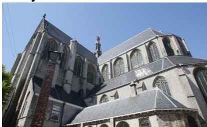
De Grote Kerk

Vraag 1: In welke Alkmaarse kerk vond de Beeldenstorm ook plaats? Zet onder de juiste kerk een kruisje.