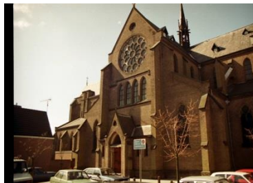
De St. Laurentiuskerk